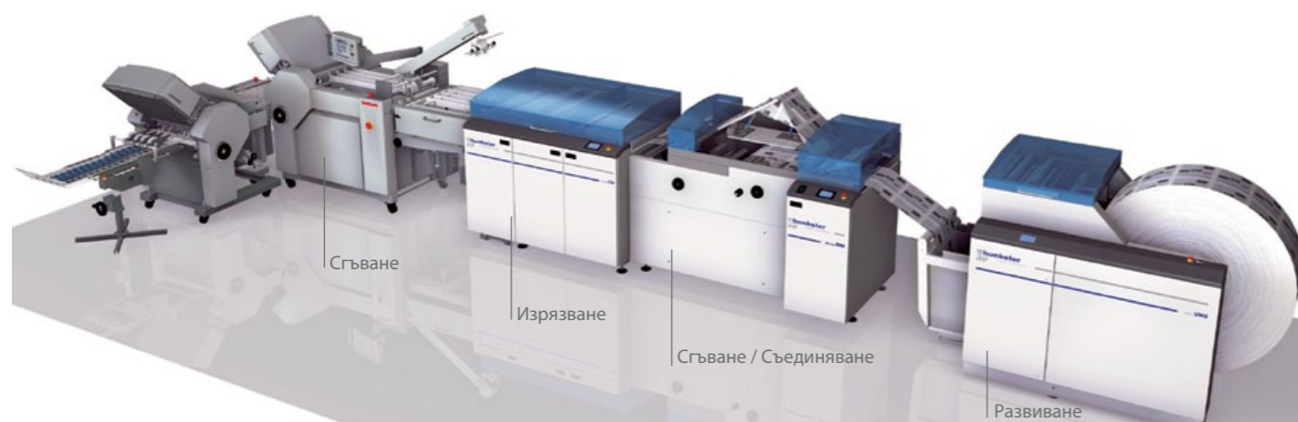
AF-566F Digital (десен ъгъл 6+4 касети) + система за обработка на листове Hunkeler

Лесни операции и усъвършенствана технология увеличават възможността за in-line финишнг с изненадващо удобни смени и гъвкаво приложение.