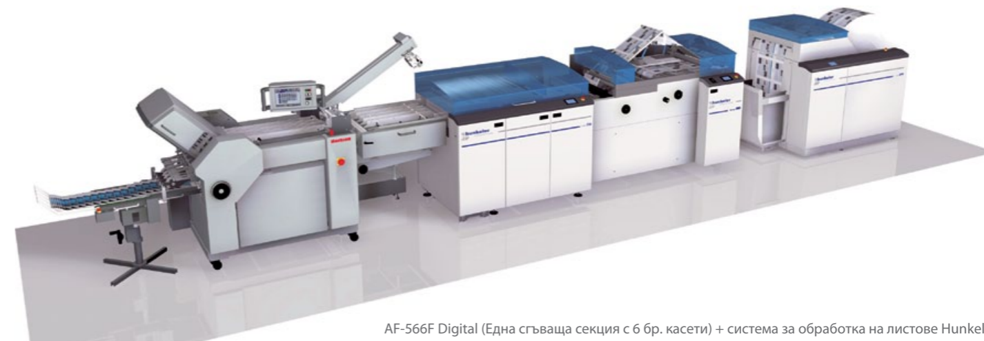
AF-566F Digital (Една сгъваща секция с 6 бр. касети) + система за обработка на листове Hunkeler