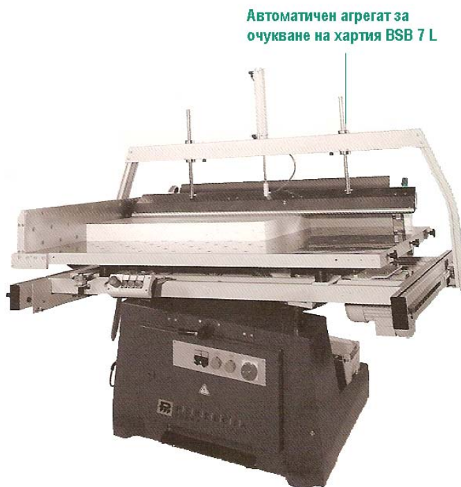
Автоматичен агрегат за очукване на хартия BSB 7 L

Очукването на готовия хартиен стапел, както и интензивното изтласкване на съдържащия се между листовете въздух, повишава точността при рязане. Същевременно така става възможно и обрязването на по-високи стапели с точно подравнени ръбове.