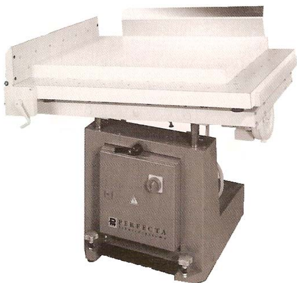
Автоматичен агрегат за очукване на хартия BSB 2 с ръчно управлявани странични ограничители

За очукване на готовите листове преди обрязване.