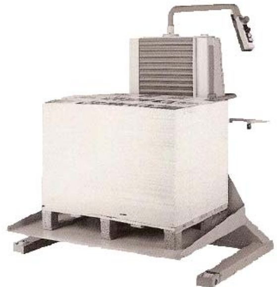
Подвижно решение: стапелен повдигач SL

Стапелните подемници се монтират директно към книговезкия нож (отляво или отдясно). Предимствата им са: